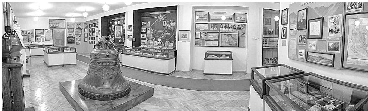
Рис. 9. Общий вид зала № 3: «Научное изучение Кольского полуострова». Музей-Архив КНЦ РАН

Следующий раздел экспозиции рассказывает об истории изучения природных ресурсов Европейского Севера в первые годы Советской власти. В 1920-е гг. научными исследованиями в этом регионе занимались Северная научно-промысловая экспедиция при ВСНХ РСФСР, организованная Р.Л. Самойловичем, и Академия наук. Среди ценнейших экспонатов Музей-Архива – материалы Мурманского геологического отряда за 1920 г., возглавляемого профессором П.В. Виттенбургом. Реалии и события тех дней отражены в работах популярного акварелиста 90-х гг. XIX в. Альберта Бенуа, полноправного участника экспедиции. Некоторые рисунки изображают местность, скрытую в настоящее время под Туломским водохранилищем (рис. 9).