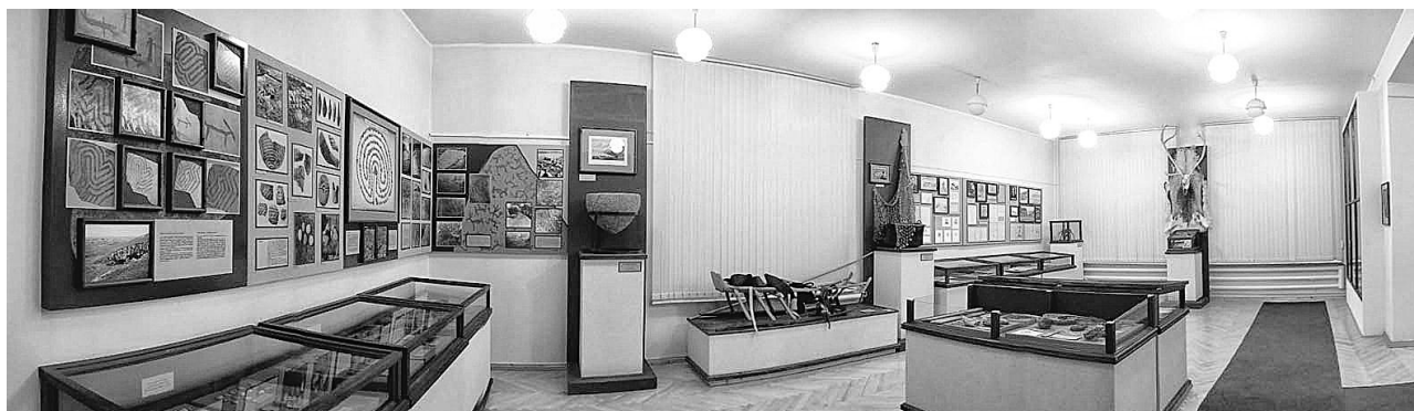
Рис. 8. Общий вид зала № 1: «Археология и этнография Кольского полуострова (автохтоны – саамы)».

Кольского Севера представлен в экспозиции коллекцией орудий, керамики, шлифовальных плит каменного века и раннего металла, найденных в результате совместных экспедиционных работ ленинградских археологов под рук. Н.Н. Гуриной и Геологического института КНЦ РАН в 1970-х гг.