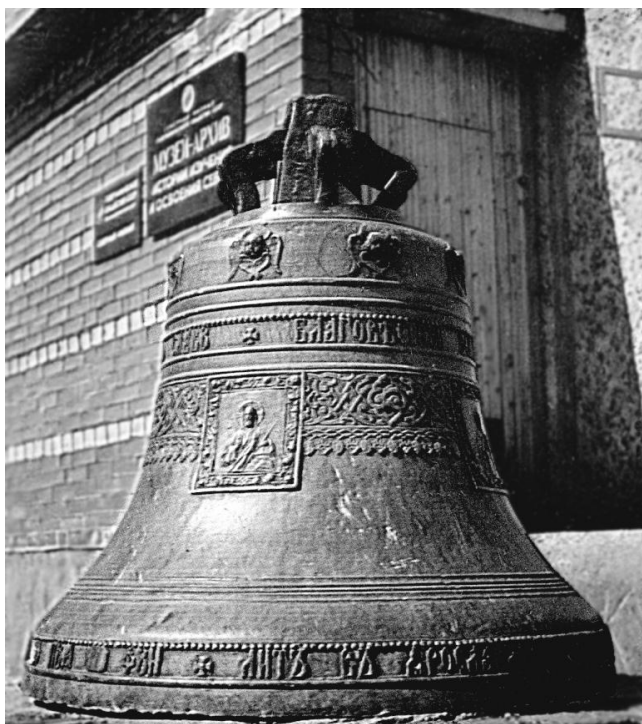
Рис. 7. Сигнальный колокол возле Музея-Архива

менялась ситуация с источниками финансирования негосударственных обществ. СФГО СССР не имел прямой финансовой государственной поддержки и существовал на отчисления по статье «Накладные расходы» из бюджета своих коллективных членов: промышленных предприятий Мурманской и Архангельской областей, автономной республики Карелия. После резкого сокращения выделения государственных средств на расходование по данной статье финансирование деятельности различных общественных организаций промышленными предприятиями было прекращено. В 1985 г. остался без финансирования и СФГО СССР. По ходатайству президента Географического общества СССР акад. А.Ф. Трешникова в Отделе экономических исследований КФАН СССР были выделены ставки научных сотрудников, на которые был принят штат Музея-Архива, и все фонды переданы КФАН СССР. Новой научно-исследовательской группе в составе отдела (а с 1986 г. – Института экономических проблем КФАН СССР) было поручено изучение малочисленных народностей Севера.