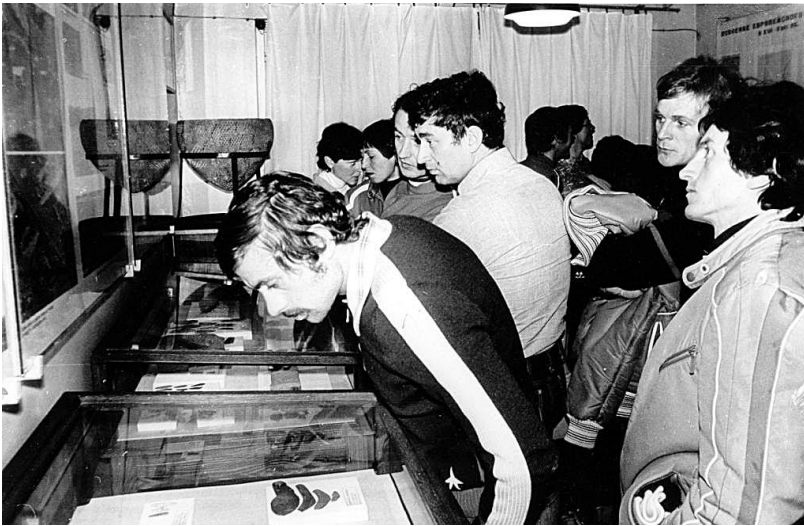
Рис. 5. Посетители первой экспозиции Музея-Архива истории изучения и освоения Европейского Севера в г. Апатиты. 1980-е гг.

Она стала практически планом-макетом, который удалось осуществить, заменив постепенно копии на подлинные экспонаты, наполнив экспозиционное пространство редкими аутентичными предметами, фотографиями, документами и даже живописью, графикой, скульптурой малых форм. А в начале своего существования музейная экспозиция, в меру наивная, завораживала посетителей немногочисленными подлинными предметами, старинными картами, неформальными документами, редкими книгами. Камерность Музея-Архива позволяла каждому