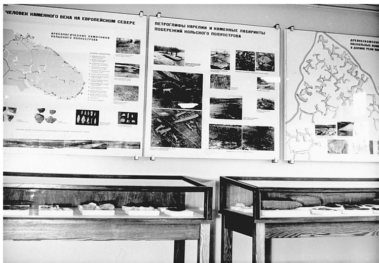
Рис. 4. Первая экспозиция Музея-Архива, 1970–1980 гг.

Конечно, первая экспозиция Музея-Архива истории изучения и освоения Европейского Севера, расположенная на площади стандартной трехкомнатной квартиры