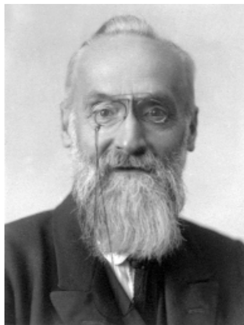
А.А. Кизеветтер. 1920-е гг.

Для дореволюционных работ Кизеветтера характерны две отличительные черты: преобладание строго документальной основы исследования и комплексный подход к освещению проблемы 3 . Вероятно, именно эти качества Кизеветтера как ученого обусловили то, что в условиях эмиграции, из-за отсутствия прочной базы в виде архивных источников, ему не пришлось создать крупные, новаторского характера работы. Вместе с тем знание научной литературы по различным проблемам или периодам отечественной истории стало фундаментом историографической рефлексии. За эти годы историком было создано немало: библиография трудов насчитывает более 500 наименований 4 . Среди них выделяются «На рубеже двух столетий: Воспоминания. 1881–1914» (Прага, 1929. 524 с.); «Московский университет: Исторический очерк. 1755–1930. Юбилейный сборник (Париж, 1930. С. 9–140); «Исторические силуэты» (Берлин, 1931. 300 с.). В свет вышли сотни рецензий и откликов на научную, художественную и публицистическую литературу,